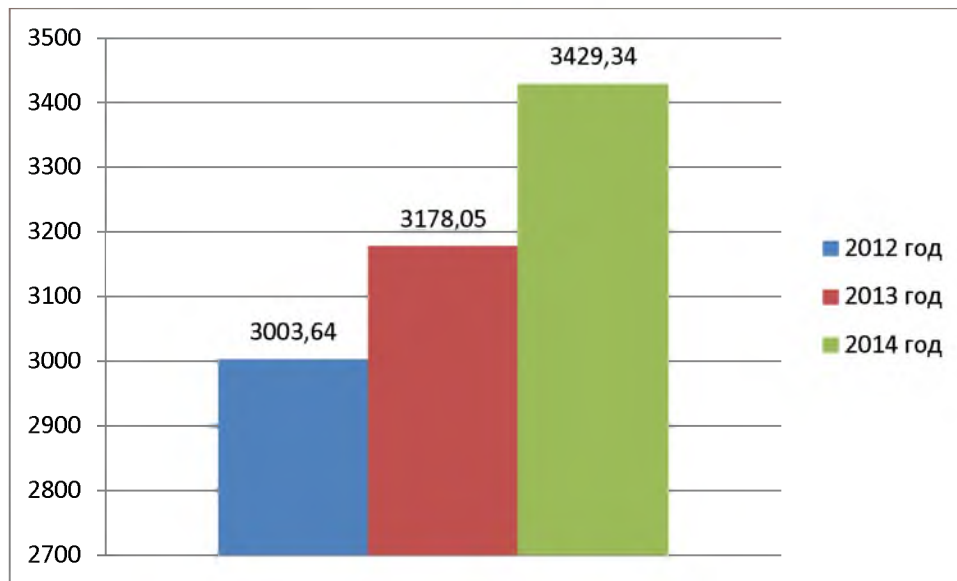
Рис. 1.3 - Динамика утверждённых тарифов.

Плата на подключение к тепловым сетям устанавливается для лиц, осуществляющих строительство и (или) реконструкцию здания, сооружения, иного объекта, в случае, если данное строительство, реконструкция влекут за собой увеличение нагрузки.