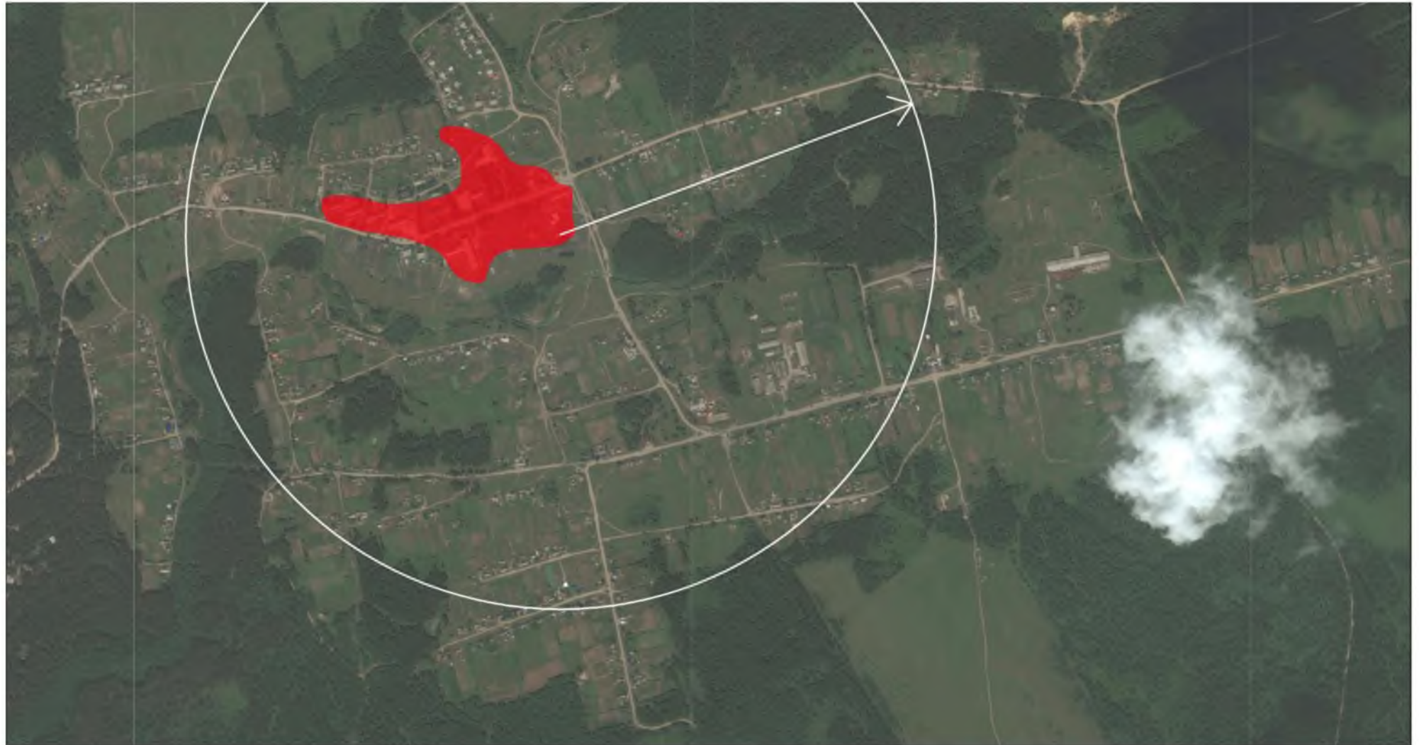
Рис. 5.1 – Радиус эффективного теплоснабжения с.Нижние Бузули