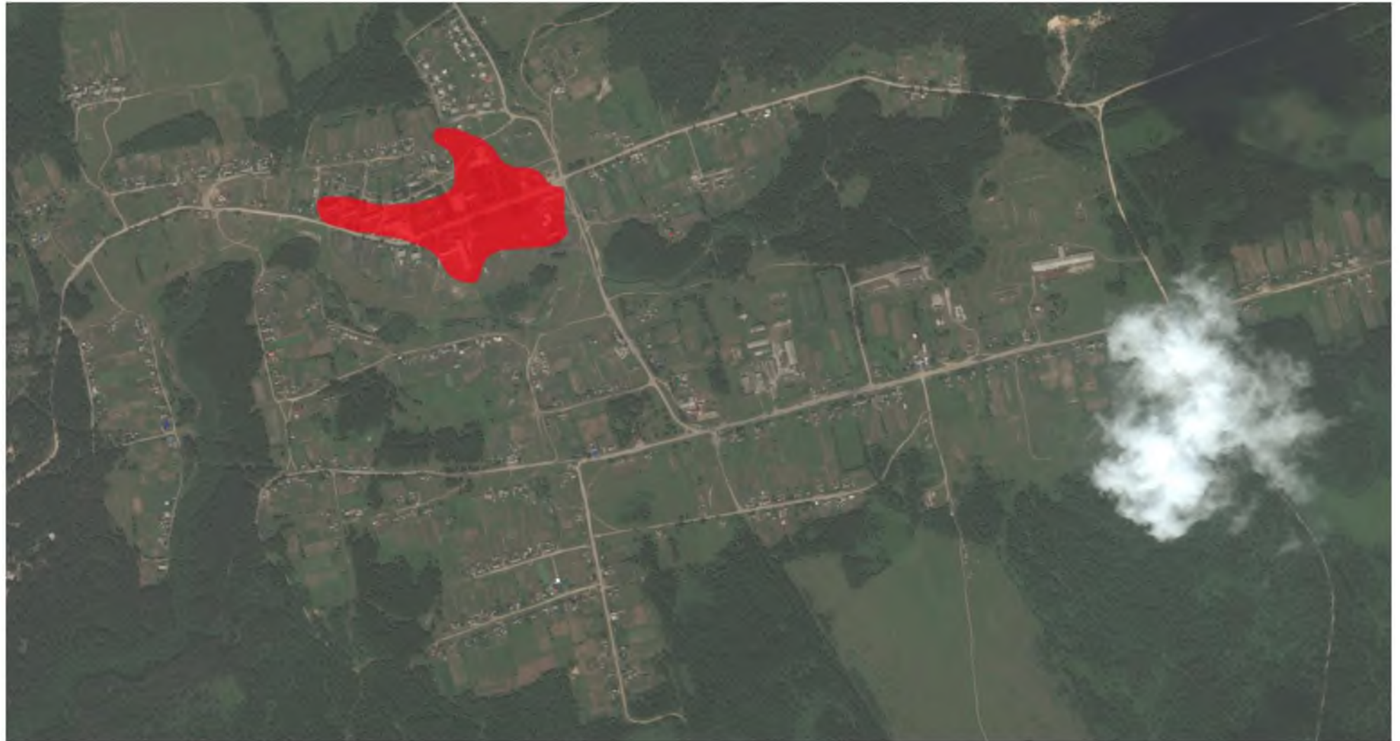
Рис. 1.1 – Зона действия теплоснабжения с. Нижние Бузули