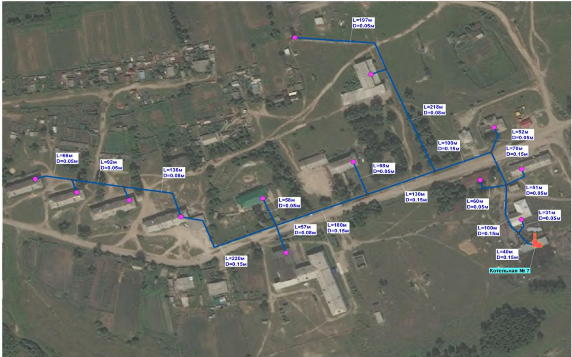
Рис 2.2 – Схема теплоснабжения муниципального образования «Нижнебузулинский сельсовет» от котельной №7