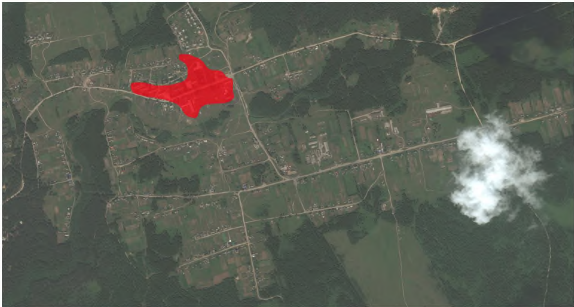
Рис. 2.1 – Зона действия теплоснабжения муниципального образования «Нижнебузулинский сельсовет»