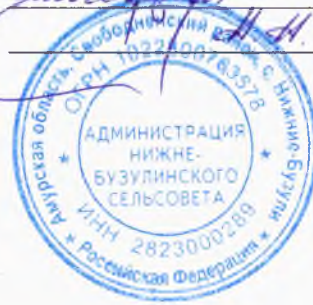
СХЕМА ТЕПЛОСНАБЖЕНИЯ МУНИЦИПАЛЬНОГО ОБРАЗОВАНИЯ «НИЖНЕБУЗУЛИНСКИЙ СЕЛЬСОВЕТ» СВОБОДНЕНСКОГО РАЙОНА АМУРСКОЙ ОБЛАСТИ ДО 2028 ГОДА

Схема муниципального образования «Нижебузулинского сельсовета» Н. Лукав.